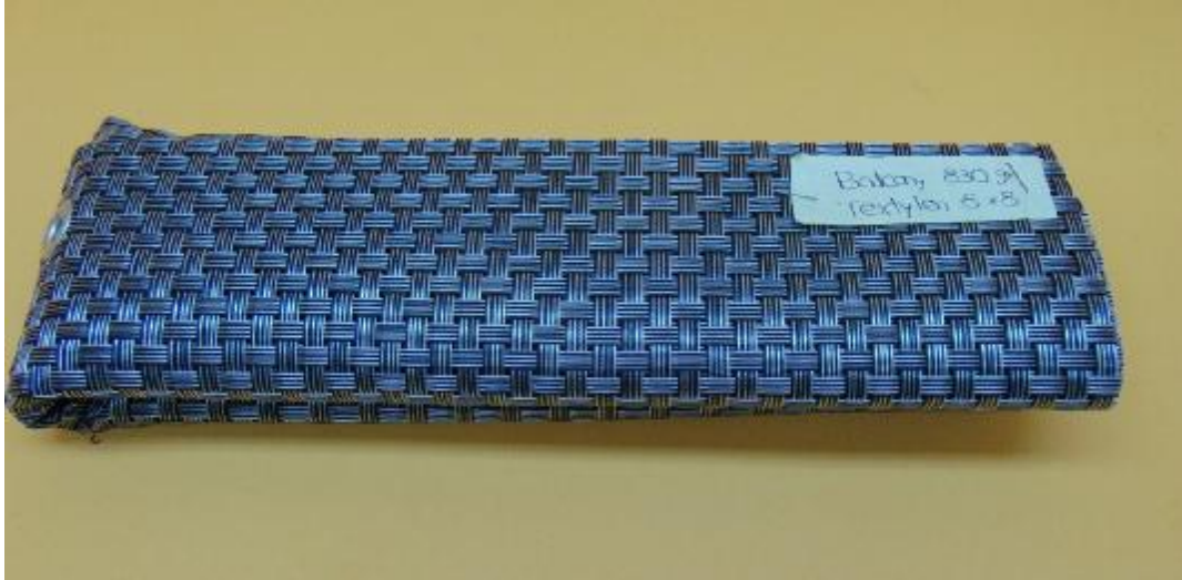
Figura 1. Muestra Balcony 830 g Textylen