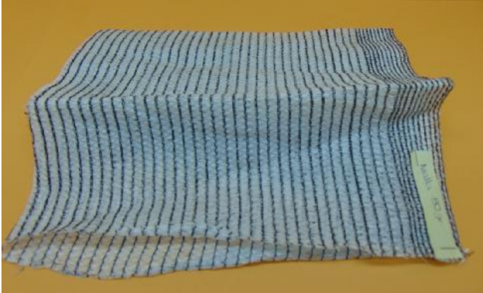
Figura 3. Muestra Malla 80 g