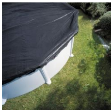
Cubierta de invierno Winter cover CIPR451