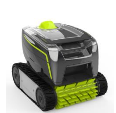
Robot Robot GT2120 / GT3220