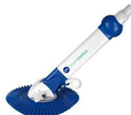
Limpiafondos automático Automatic cleaner AR20682