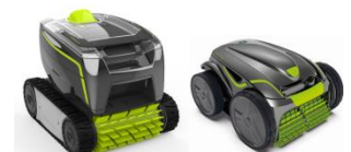
Robot Robot GT3220/GV3420