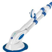
Limpiafondos automático Automatic cleaner 90399