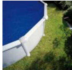
Cubierta isotérmica Isothermic cover CPROV505