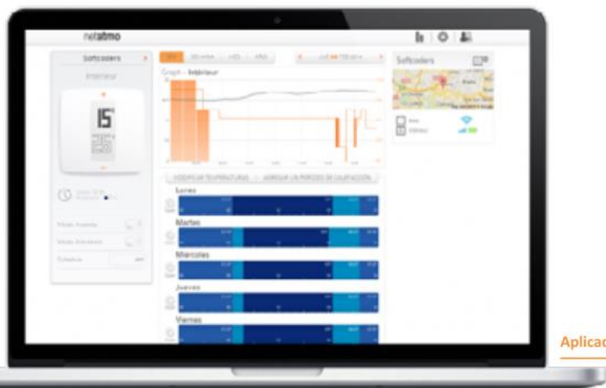
Aplicación PC / MAC