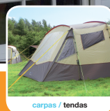
carpas / tendas