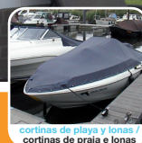
cortinas de playa y lonas / cortinas de praia e lonas