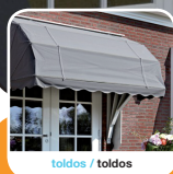
toldos / toldos