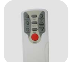
Mando a distancia