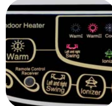
Panel de control