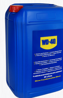
Bidón 25 litros

Garrafa para uso industrial que é acompanhada de um pulverizador para uma aplicação mais simples