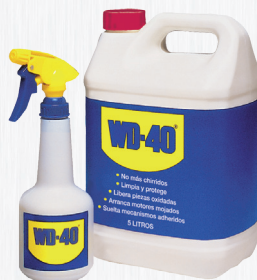
Garrafa 5 litros

O formato Dupla Acção permite uma aplicação ampla ou precisa do produto, garantindo que a cânula nunca se perderá