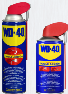
Spray Dupla Acção 250ml e 500ml

A lata de 400ml representa um tamanho indispensável para um uso mais intensivo do produto